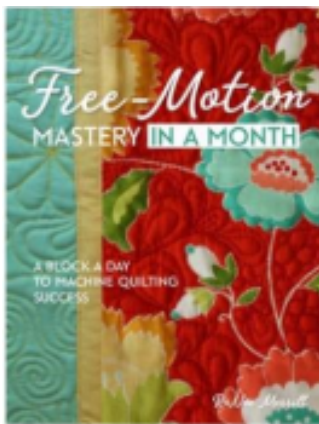
Free-Motion Mastery in a Month

* בסדנאת התיפורים נלמד לעשות free motion quilting